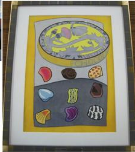
受賞盾と副賞(題目:「チョコ休み」井隼慶人 様 作)