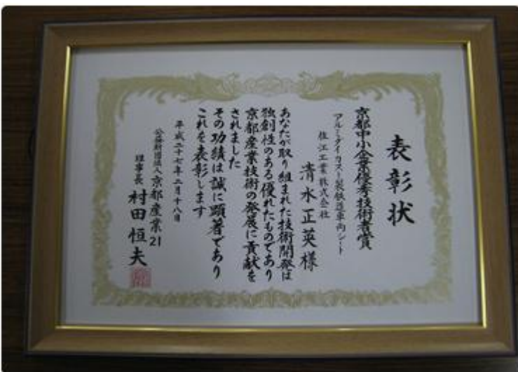
京都中小企業優秀技術賞の表彰状