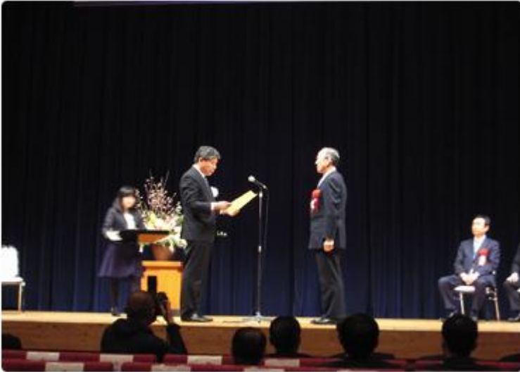
山下副知事より表彰状を受け取る兼子社長