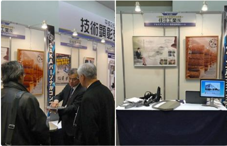
住江工業ブースでのお客様への説明風景